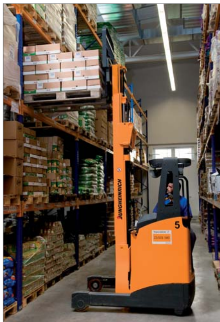
Tolóoszlopos magasemelésű targonca