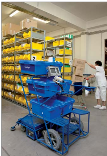
Önjáró INFO-MOBIL a ládákkal