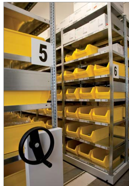
Hűtött raktár gördíthető állványsorral

raktár jelenleg több mint 8000 tárhellyel rendelkezik, a rendszerben pillanatnyilag 5000 forgalmazott árucikk szerepel (ebbe valamennyi különböző kizserelés is bele tartozik).