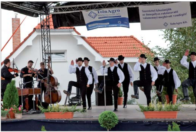
Megnyitó műsor a színpadon