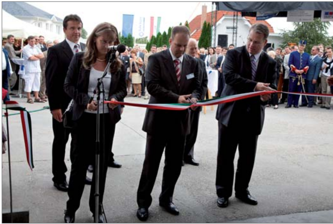
Nagy pillanat: a nemzeti színű szalag átvágása a raktár bejáratánál